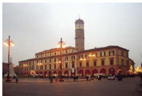
Radnice ve Forlì v Itálii, odkud svatý Peregrin pocházel

vený Služebník Mariiných (servitů) Filip Benizi a snažil se usmířit dvě strany zápasící o vládu, stranu šlechtickou a městskou – občanskou. Nejenže se jeho snaha míjela účinkem, ale při jednom kázání byl Filip hrubě uražen a mladý Peregrin jej uhodil do tváře. Filip však mlčky snášel příkoří a Peregrinovi po políčku nastavil ještě tvář druhou, prose v duchu za všechny nepřátele. To v Peregrinovi způsobilo zvrát. Dojat mírností a láskou řeholníkovou poklekl před Filipem a prosil za odpuštění. V následujících dnech a měsících se ohnivý a vznětlivý šlechtic změnil v pokorného služebníka všech.